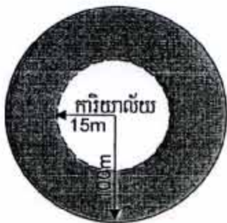
តំបន់បរិវេណខាងក្នុង-ខាងក្រៅ នៃការិយាល័យបោះឆ្នោត និងរាប់សន្លឹកឆ្នោត

ការិយាល័យបោះឆ្នោត និងរាប់សន្លឹកឆ្នោតនីមួយៗ មានបរិវេណខាងក្នុងជាតំបន់ដែលនៅជុំវិញការិយាល័យបោះឆ្នោត និងការិយាល័យរាប់សន្លឹកឆ្នោតខណ្ឌដោយវ៉ែនណូមណូលមួយដែលមានកាំប្រវែងយ៉ាងតិច ១៥ ម៉ែត្រ និងបរិវេណខាងក្រៅ ជាតំបន់ដែលនៅជុំវិញការិយាល័យទាំងនោះខណ្ឌដោយវ៉ែនណូមណូលមួយដែលមានកាំប្រវែង ១០០ ម៉ែត្រ ឬ មានទម្រង់ផ្សេង ឬមានកាំតូចជាងស្របទៅតាមស្ថានភាពជាក់ស្តែងនៃបរិវេណខាងក្រៅរបស់ការិយាល័យនីមួយៗនោះ ។